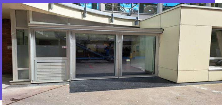
Salle d'attente des consultations de neurochirurgie pédiatrique. Modification des portes de sortie de secours.

Démarrage des travaux d'ouverture des accès pompiers au niveau de la tour incendie, impactant les étages à 1 à 6 du Nouveau Bâtiment.