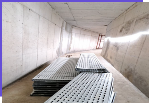
Réalisation de la galerie technique enterrée, située sous l'aile Moreau