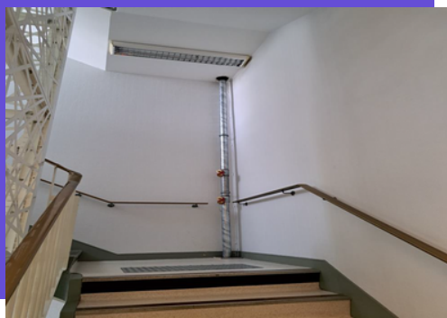
Avancement de 80% des travaux Colonnes sèches